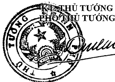
Vương Đình Huệ