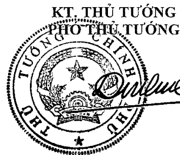
Vương Đình Huệ